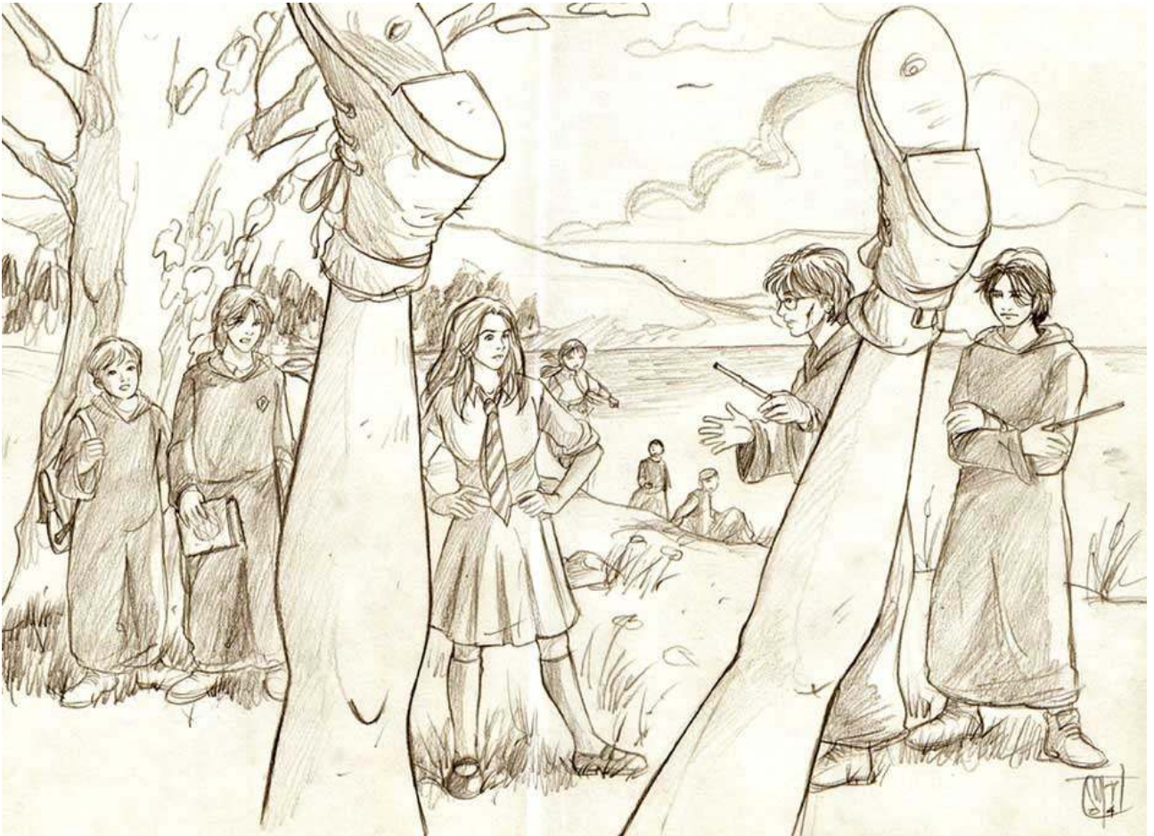
[Tratto da Harry Potter e l'Ordine della Fenice di J.K. Rowling; Traduzione di Serena Tardioli; Disegni di Marta ( http://seviet.livejournal.com/ ). Shoebox is Love! ♥]